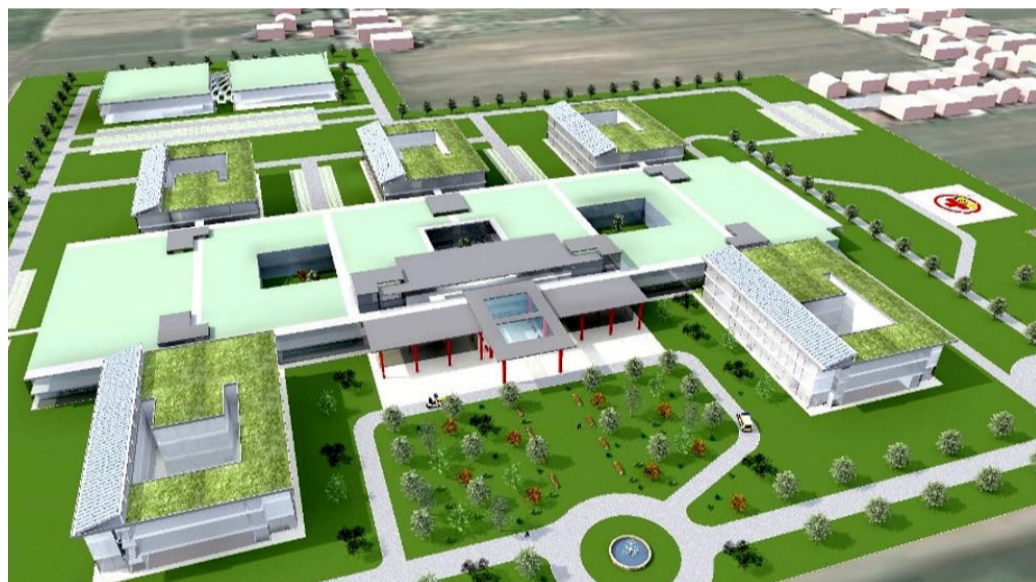
Si svilupperà in prossimità del casello autostradale Cesena Sud, su una superficie totale di 75mila metri quadrati.