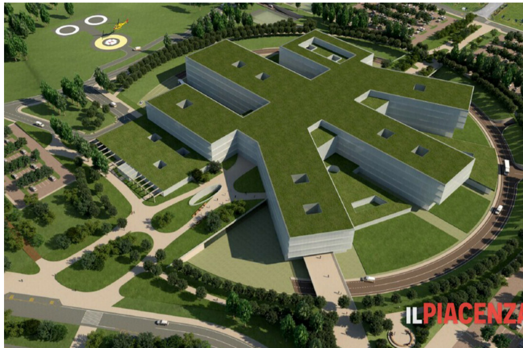
Piacenza, previsti 1500 parcheggi, l'area occupata è di 272mila metri quadrati, verranno piantumati 1400 alberi

Come si può ben notare, intorno a due ospedali, rendering di quello da costruire a Piacenza e quello nei pressi di Milano. Entrambi (ma potete andare a cercarne altri) nel mezzo di centri abitati? Assolutamente no.