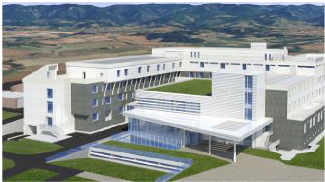
Ospedale del Mugello. 10700 metri quadrati. Con un investimento complessivo stimato di 36.000.000,00

Samb Calcio, la situazione diventata insostenibile. La città sportiva merita molto di più. Tutto potrebbe rinascere con una cittadella dello sport e uno stadio di proprietà. Campa cavallo che l'erba cresce? Speriamo di no