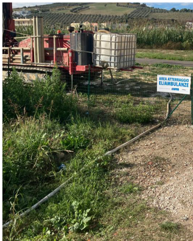
Abbozzo di carotaggi in zona Ragnola?

Semplicemente perché dal XVIII secolo a metà del XX secolo anche Montefiore, Ripatransone, il “Madonna degli Angeli” a Grottammare avevano un loro ospedale.