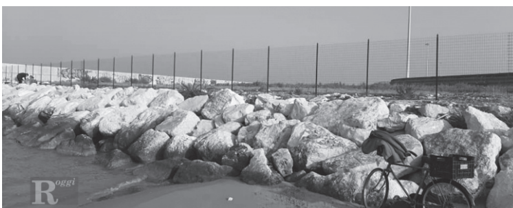
LA CASSA DI COLMATA GIÀ ESISTENTE